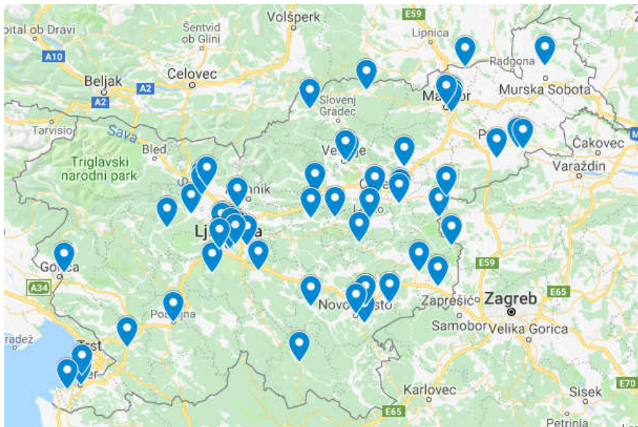
Vključene šole, organizacije 2018-19, izziv V VESOLJE

Najboljše ekipe se uvrstijo na Odprto državno prvenstvo - Finale regije Adria, najboljši v regiji dobijo povabila na evropska, svetovna prvenstva, ki bodo v sezoni 2018/19 v Turčiji, v Libanonu, Urugvaju in v ZDA.